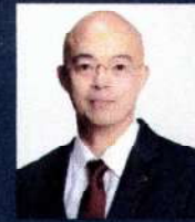
ดร.ศุภกร สิทธิโชค อดีตนายกสมาคมการค้าระหว่างประเทศ สังกัดกรมส่งเสริมการค้าระหว่างประเทศ