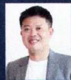
ผศ.ดร.รุ่งโรจน์ โชติงามวงศ์ ประธานเจ้าหน้าที่บริหาร สังกัดกรมส่งเสริมการค้าระหว่างประเทศ