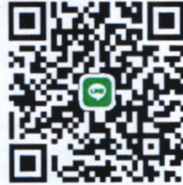
QR Code กลุ่มไลน์เพื่อส่งผลงาน